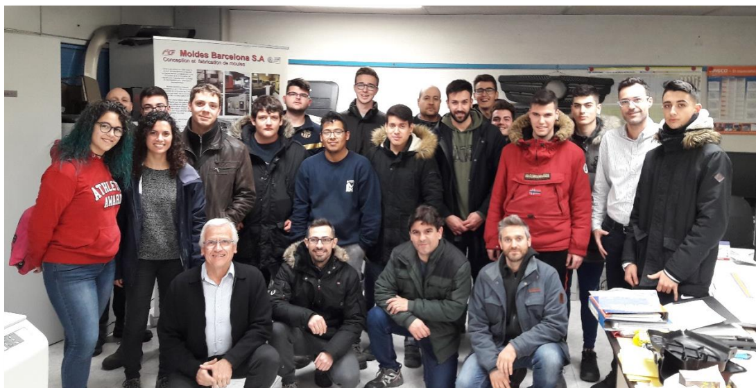
Visita dels alumnes de l'Ins Manolo Hugué a l'empresa associada Moldes Barcelona

Per tal que els alumnes coneguin el sector, s'organitzaran visites a les empreses d'ASCAMM que vulguin acollir alumnes. També s'organitzarà la formació de tutors, les entrevistes del alumnes a les diferents empreses participants i els tràmits administratius de la contractació en mode Dual. També es convidarà a les empreses d'ASCAMM a participar en activitats com la jornada de portes obertes.