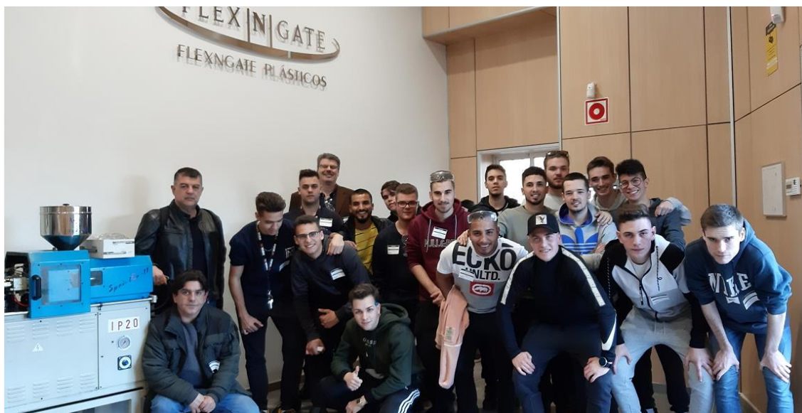
Visita dels alumnes de l'Ins Manolo Hugué a l'empresa associada FLEX N GATE

Per tal que els alumnes coneguin el sector, s'organitzaran visites a les empreses d'ASCAMM que vulguin acollir alumnes. També s'organitzarà la formació de tutors, les entrevistes del alumnes a les diferents empreses participants i els tràmits administratius de la contractació en mode Dual. També es convidarà a les empreses d'ASCAMM a participar en activitats com les jornades de portes obertes.